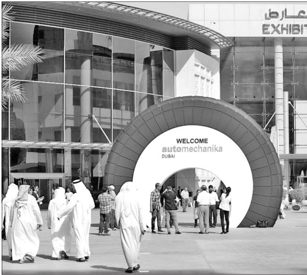
• جانب من معرض أوتوميكانيا دبي