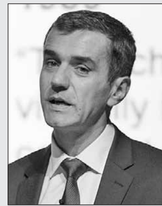
• إيليان ميهوف

وقامت مبادرة كارتية بإنشاء ما يسمى بشبكة جوائز كارتية لجميع من ترشحن للحصول على الجائزة، تشمل مجموعة على موقع لينكد إن، وصفحة على فيسبوك، وحساب على موقع تويتر ومنصة متخصصة على شبكة الإنترنت، بالإضافة إلى البريد الإلكتروني والمكالمات الهاتفية. وذلك بهدف تسهيل التواصل بين الشركات اللاتي يعملن في نفس القطاع بالإضافة إلى تبادل المعرفة والخبرات فيما بينهن. وقال إيليان ميهوف، عميد كلية إنسياد، تتشرف كلية إنسياد بكونها جزءا لا يتجزأ من جوائز كارتية للمبادرات النسائية منذ تأسيسها في عام 2006. ويكشف تقييمها لأثر الذي حققته هذه الجوائز منذ عشر سنوات، حجم الإنجاز الحقيقي للبرنامج والمساهمة البارزة له في خلق جيل من القيادات النسائية. ويعكس كل من الالتزام والمشاركة الذي أبداه المشاركون تفاني الكلية وإخلاصها في التميز والابتكار والتوسع.