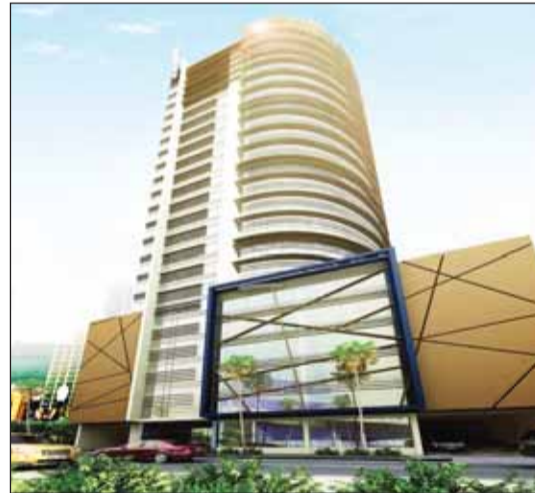
• برج فيتا في البحرين