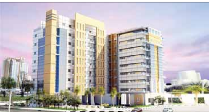
• بوابات السيليكون