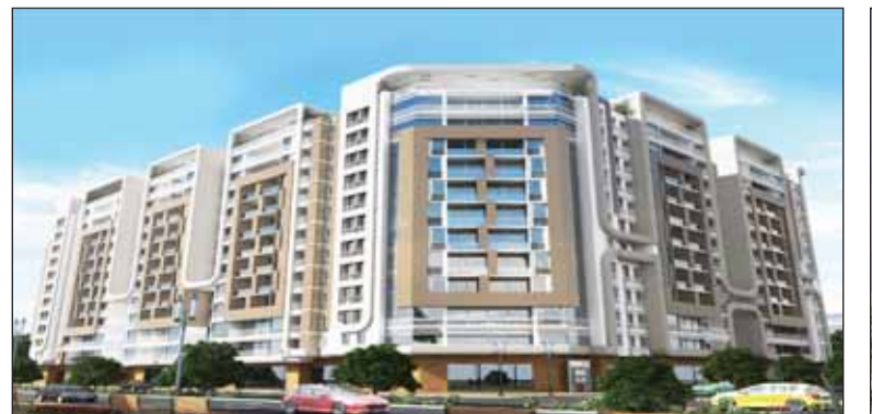
• كابيتال ايست

تطرح شركة ريماكس مشروع الحديقة في سلطنة عمان، الذي يتم العمل عليه حالياً، وهو عبارة عن 3 بنايات متصلة مقامة على مساحة 2700 متر، مكونة من 86 شقة، كل بناية 5 أدوار، إضافة إلى الخدمات الفندقية، وتم الانتهاء حالياً من بناء الدور الخامس، وجار الانتهاء من التشطيبات