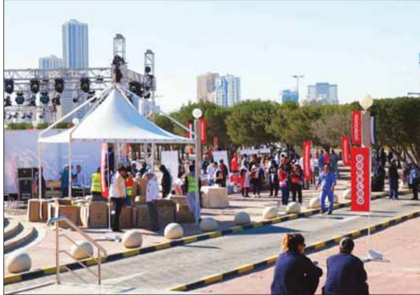
• مسرح Ooredoo

وأضاف عفيقي: لا ينكر أحد وجود تحديات من اكتشاف البنوك على العقار، ولكن هذا الانكشاف يعود في الأساس إلى الربحية المستقرة والمتزينة للاستثمار في العقار ونجاحه في المحافظة على مكاسبه في وقت تنهأ في فيه الاستثمارات في بعض القطاعات الأخرى، حيث نجد أن القطاع العقاري في الكويت بدأ ازدهاراً تصاعدياً منذ 2009 وبلغ نموه السنوي من حيث القيمة 27%، ومما يؤكد هذا الازدهار نمو أرباح القطاع المصرفي. واختتم تصريحه قائلاً: إن «إسكان غلوبل» تجدد في هذه الدورة التزامها الثابت بتسخير كل جهودها وطاقاتها للارتقاء بصناعة المعارض، كما نقدم بالشكر لشركاء النجاح من رعاة وشركاء مشاركة وزوار ولجميع العاملين في مجموعة إسكان غلوبل على جهودهم الوافرة التي صنعت هذا النجاح.