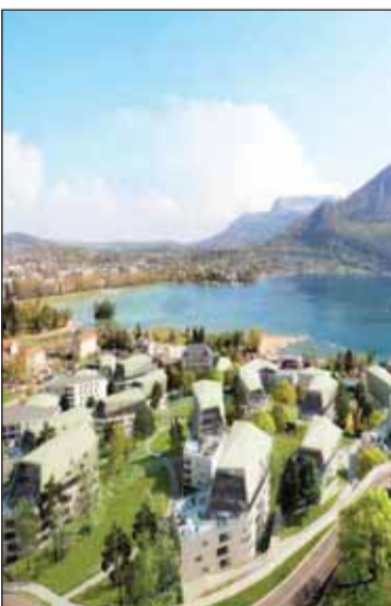
• مشروع لافون سين

مشروع بوابات السيليكون في دبي، البالغة كلفته 350 مليون دولار، الذي سيقوم بعرض مجموعة جديدة من الشقق، والذي حقق نجاحاً كبيراً بعوائد تجارية تراوحت بين 8% و10% في العام المنصرم. حيث أن المشروع قد شارف على الانتهاء والتسليم في غضون أشهر قليلة.