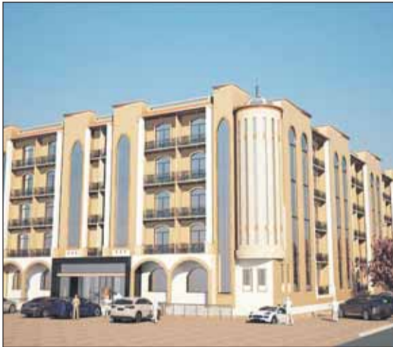
• الحديقة في سلطنة عمان