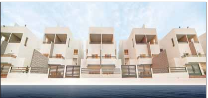
• مشروع أموال الخيران