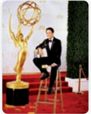
من حفل توزيع الجوائز

والتي جانب تشكيلة من أرقى أنواع السجاد، ستجدون آلاف من قطع الاكسسوار التي تضفي على منازلكم أجواء من الفخامة والرقي. أما جولاتكم في أقسام مستلزمات المائدة، والأثريات والنحف والمفروشات، أو قسم الشموع والأزهر، فهي ضرورية أيضاً للحصول على ما تحتاجونه لبيت العمر، الذي لا يمكن ان تكتمل غرفه الا بزيارة لقسم غرف الأطفال، حيث قطع الأثاث التي تتميز بالبهجة لتتناسب أذواق أطفالكم، وتلبي احتياجاتهم.