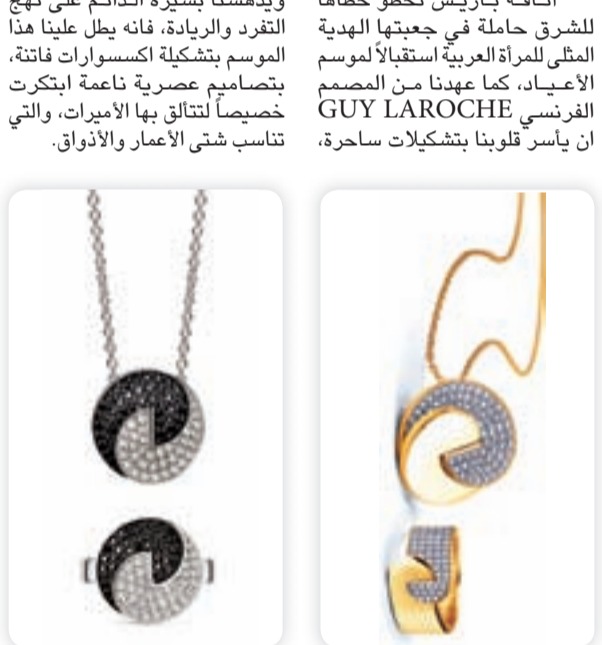
من التشكيلة الجديدة

ويدهشنا بسيره الدائم على نهج التفرّد والريادة، فانه يطل علينا هذا الموسم بتشكيلة اكسسوارات فائقة، بتصاميم عصرية ناعمة ابتكرت خصيصاً لتتلاقى بها الأميرات، والتي تناسب شتى الأعمار والأذواق.