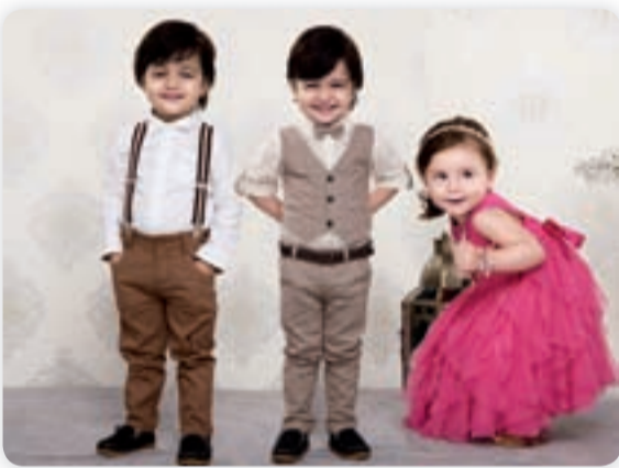
من التشكيلة الجديدة

وللليرز. ولأولاد نصيبهم أيضاً ان تقدم لهم التشكيلة الجديدة تصاميم راقية تمنحهم شعوراً غامراً بالراحة والانتعاش بالوان البني والأزرق البحري، الى جانب بعض اللمسات من اللون البرتقالي والبرونزي على الجيوب والوجه الداخلي من القمصان لتضفي على هذه المجموعة من الملابس طابعاً صيفياً راقياً. تقدم التشكيلة الجديدة مزيجاً متنوعاً من الألوان والتصاميم والخيارات بأسعار معقولة، وتعد باطلاة لا مثيل لها للأطفال حديثي الولادة حتى سن 16 عاماً. وبالتزامن مع قرب قدوم العيد، أطلق «شومارت» مجموعة متميزة من الأحذية النسائية التي تلائم كل قدم. وتشمل هذه المجموعة الساحرة أحذية الكعب العالي والكعب الرفيع.