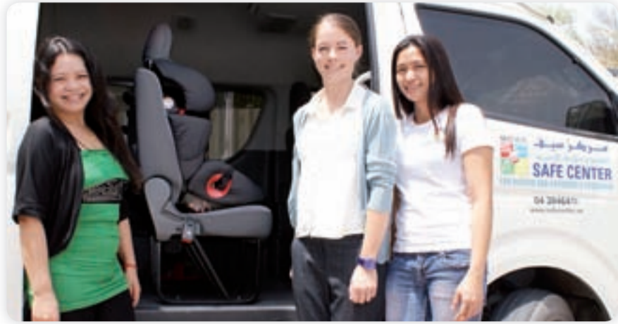
المشاركات في تقديم التبرعات لمركز «سيف»

أصبح الانتقال من وإلى المدرسة أكثر أماناً الآن بالنسبة للأطفال التوحد ومتلازمة أسبرغير، وذلك بفضل التبرعات السخية المتصلة بمقاعد أطفال سعة حافلة كاملة، المقدمة من شفروليه الشرق الأوسط. وجاءت هذه التبرعات لمركز «سيف» (SAFE) للأطفال التوحد ومتلازمة أسبرغير كجزء من مهمة شفروليه في رد الجميل للمجتمع وزيادة الوعي تجاه أهمية ربط أحزمة الأمان.