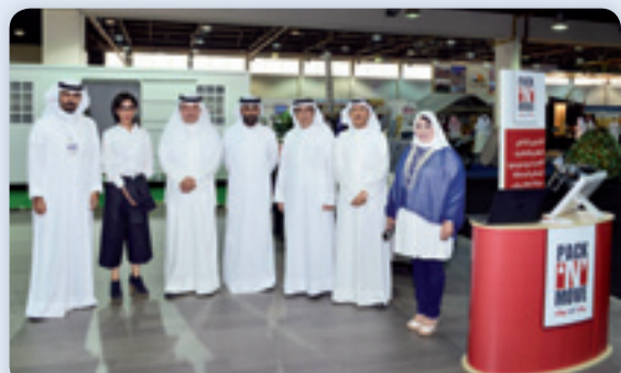
• صورة جماعية داخل جناح الشركة

استمرت حتى الامس في أرض المعارض بشرف قاعة (4) قدمت خلالها العديد من الخدمات والمنتجات التي يحتاج لها رواد هذا النوع من المعارض وطرحه كل ما هو جديد كالمخازن المتحركة وهو المنتج الحصري لدى الشركة والاذكي لعمليات التخزين بالإضافة الى الخدمات المستقبلية على المدى القصير كمخازن الدراجات النارية وأرشفة الملفات ومخازن التبريد وصولاً الى الأحدث وهي خدمات صيانة العقد الواحد للمنازل والشركات والتي من شأنها صيانة كل من الأدوات الصحية والمصاعد والتكييف.